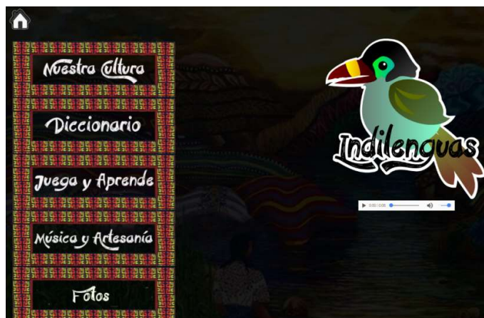
Figura 2: página principal pueblo Embera Chami

Para la modificación de las imágenes contenidas en la plataforma se hace necesario el uso de herramientas de diseño gráfico como Corel draw o Gimp