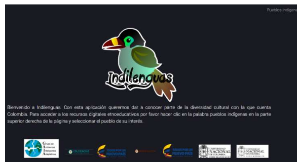
Figura 1: página inicial Indilenguas

Archivo índex: este archivo permitirá la modificación de la página inicial de la plataforma la cual se muestra en la Fig.1