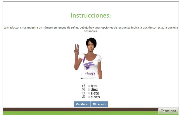
Fig. 3. Actividad de Elegir, para el aprendizaje evaluativo de números.

La herramienta presenta diferentes categorías de conceptos a nivel básico, que sirven de marco introductorio a la enseñanza de la LSC y permiten la divulgación de la lengua. Por lo cual se optó por implementar categorías básicas enfocadas a conceptos generales, propios de la cotidianidad. Estas categorías irán ligadas a los diferentes tipos de actividad. Las categorías denominadas números y alfabeto pertenecerán a todas las actividades expuestas anteriormente y las categorías de objetos, alimentos y animales solo serán incluidas en la actividad señas.