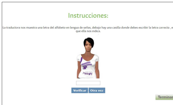
Fig. 2. Actividad Responder, para el aprendizaje evaluativo de alfabeto.