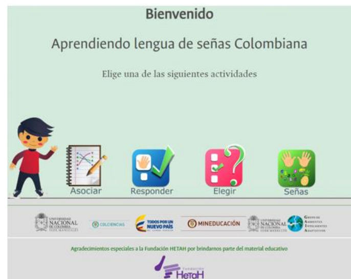
Fig. 5. Interfaz principal del recurso educativo web.

Para el etiquetado y el almacenamiento de los objetos de aprendizaje obtenidos en la construcción de este recurso educativo, se utilizó el Repositorio de Objetos de Aprendizaje ROAp [3].